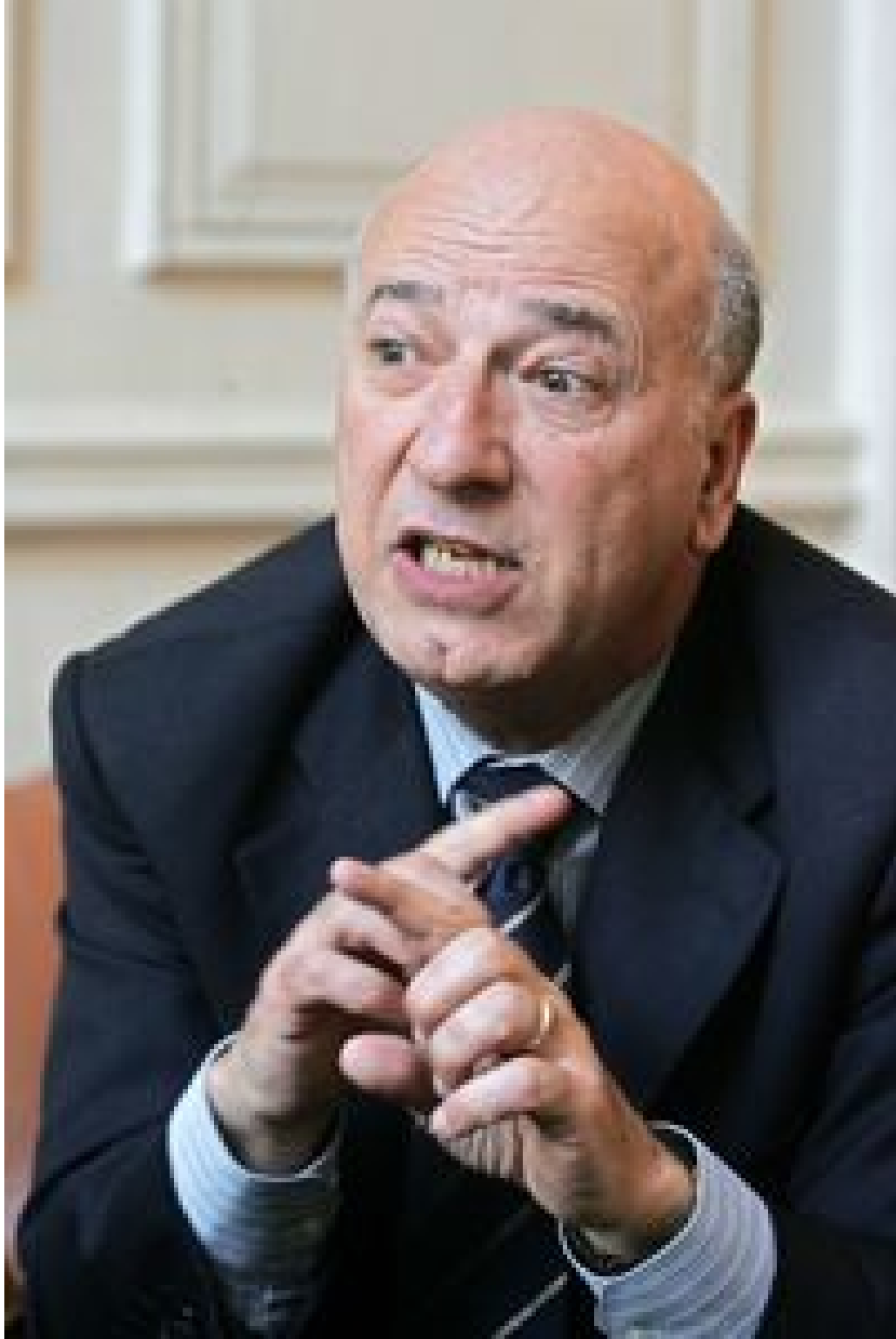
( http://seg.reader.ecn.cl/2016/05/09/content/pages/img/mid/CU2U75QE.jpg )